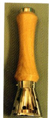
MT式温灸器具 (鈴木医療器具社製)