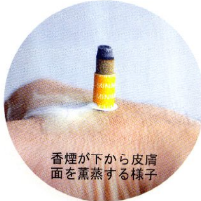
香煙が下から皮膚面を薫蒸する様子

本『香煙管』は、こうしたモグサの薫煙効果を再認識し、効率よく利用するため、高品質で定評のある韓国産ヨモギの100%微粉末を管状に成型する事により管内に熱対流を発生させ(右図)、従来のお灸類では不十分であったヨモギ薫煙成分の皮膚薫蒸吸着効果をより一層高めたものです。